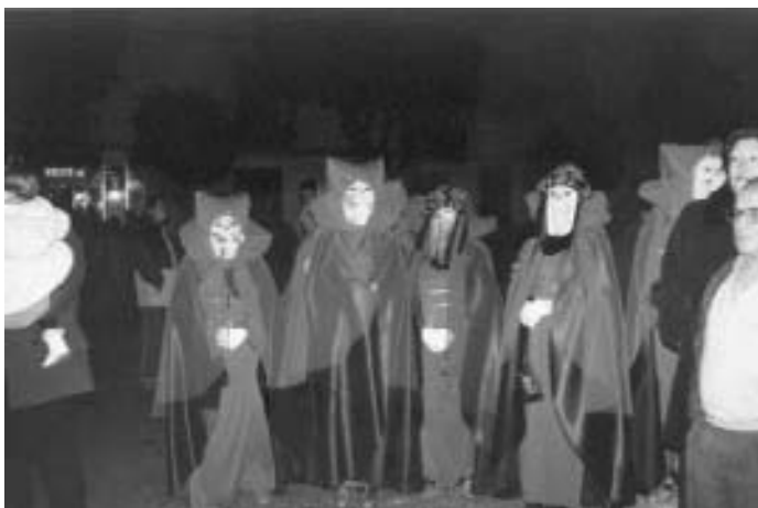
Varias comparsas acudieron a la plaza

Con más de media hora de retraso respecto al horario previsto, el sábado 9 de Febrero se iniciaba el Desfile de Comparsas casi a las 21.45 horas. Cuatro agrupaciones concursaban para la consecución de los premios a la «Mejor comparsa desfilando» (120,20 euros), «Mejor indumentaria» (180,30 euros), y «Mejor letra» (otros 120,20 euros). Sin embargo, sólo hubo participación relacionada con los dos primeros premios. Durante un buen rato, la Plaza estuvo animada con los ladridos de «101 Dálmatas»,