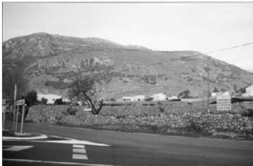
Terreno donde se construirá el IES

(BOJA núm. 19, de 14-02-2002; pág. 2.304)